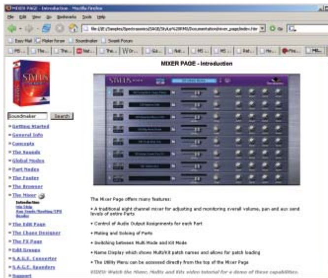
Φωτό 3. Πολύ καλό documentation, μεγέθους 68.000 λέξεων, με search engine.