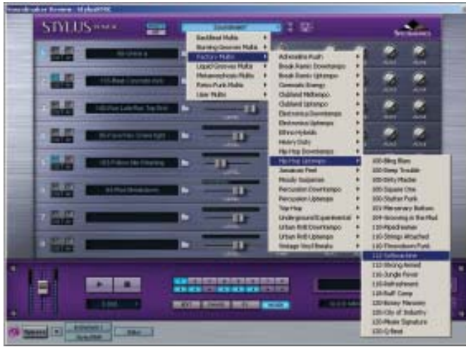
Φωτό 1. Πολλά τα νέα Multis, χωρισμένα σε 21 κατηγορίες

μία υποκατηγορία με όνομα Tonal Elements, στην οποία βρίσκονται λούπες που έχουν κάποιο τονικό ύψος, καθώς περιέχουν samples μπάσου, κιθάρας ή άλλων ήχων και είναι πολύ ευπρόσδεκτες για τα αρχικά στάδια κάποιας ιδέας. Επίσης, μία άλλη υποκατηγορία με όνομα 4x4 Kicks περιέχει λούπες από kicks (μόνο) στο κλασικό clubby “four on the floor” στιλ και είναι προφανούς χρησιμότητας για όσους ασχολούνται με χορευτική μουσική.